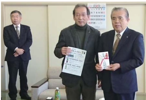
織戸会員 (株)やつや様 義援金贈呈