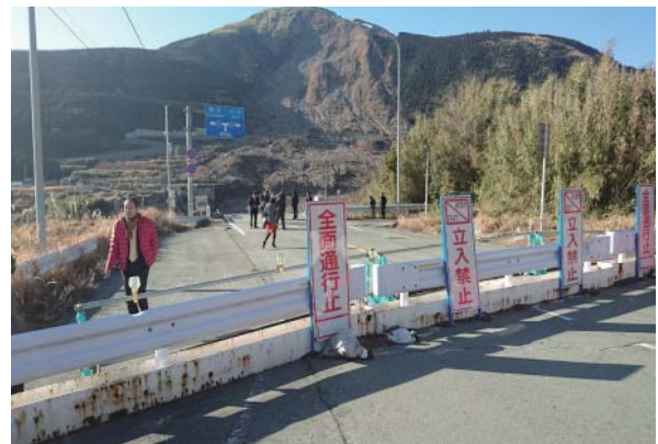
阿蘇大橋崩落現場