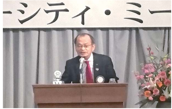
岡田第2分区ガバナー輔佐挨拶