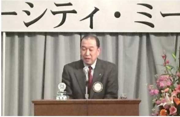
ホストクラブ佐々木会長の歓迎の言葉