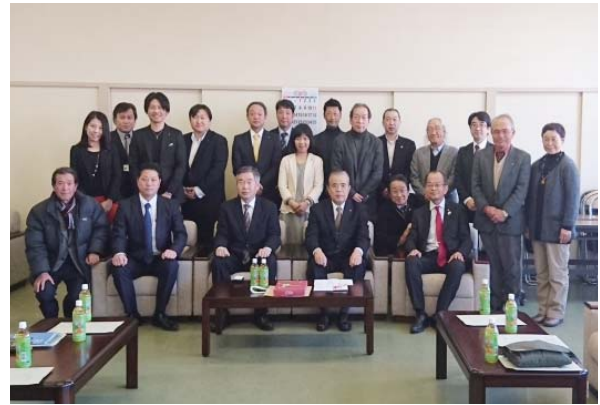
南阿蘇村 表敬訪問