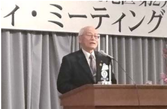
第2790地区白鳥バストガバナー卓話